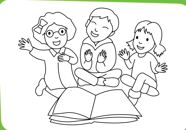
Sing a rhyme