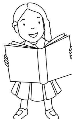
Siarad am luniau mewn stori