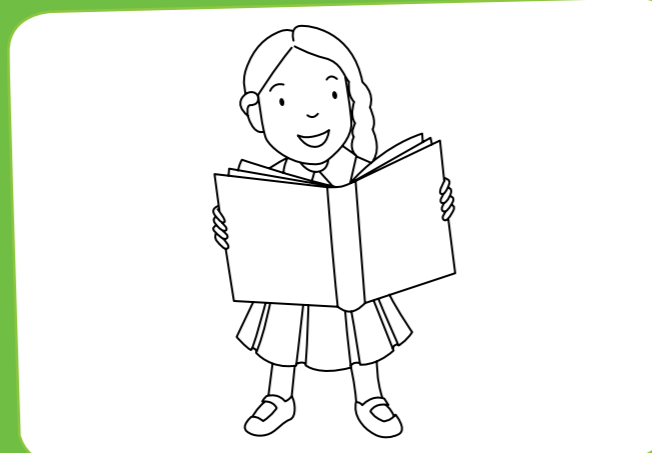
Talk about the pictures in a story